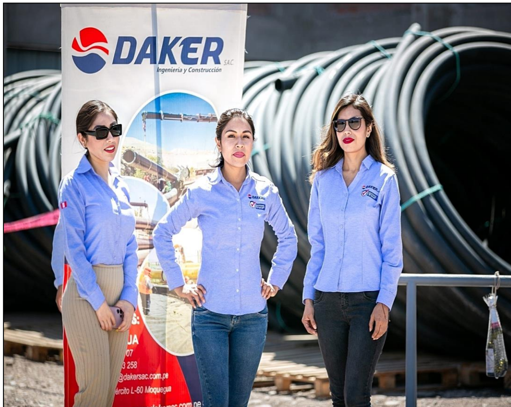
Anexo 1: Panel Fotográfico de actividades de la Empresa.